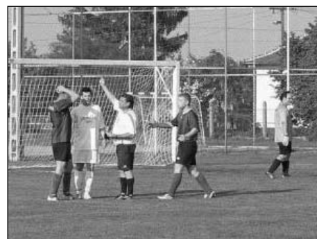
A kiállítás pillanata

• Május 3-án, vasárnap délután kilátogattam a futballpályára. Tóalmás csapatát fogadtuk itthon. Nagy volt a tét, mivel győzni kellett ahhoz, hogy a tabellán 5. helyen kiemelt Almással helyet cseréljünk. Így maradt volna meg az esélyünk, hogy a rájátszás során felsőbb osztályba kerüljünk. Nem