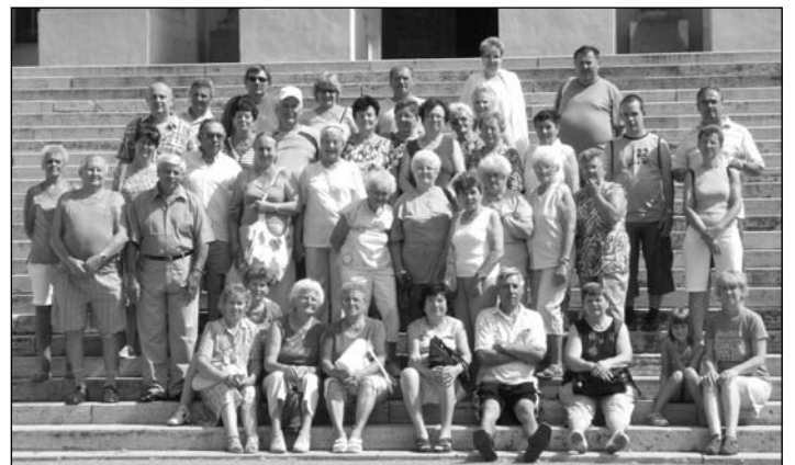
Szegedi Móra Ferenc Múzeum