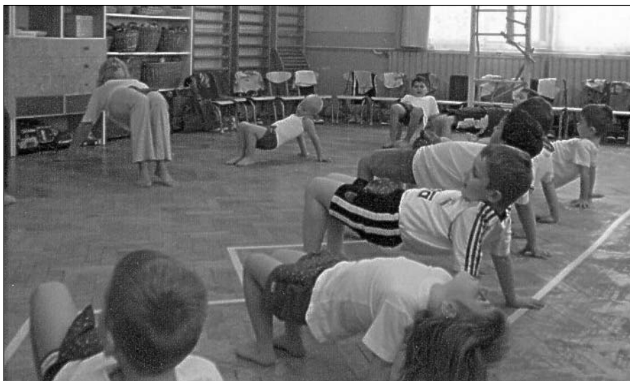
Testnevelés foglalkozás az „Alma” csoportban

A délelőtti folyamán több mozgásos anyanyelvi játékra került sor, melyek a mozgáson keresztül fejlesztik a gyermekek gon-