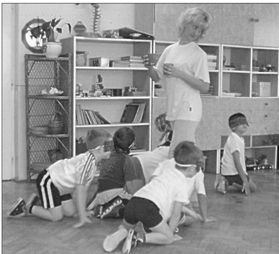
Testnevelés foglalkozás az „Alma” csoportban