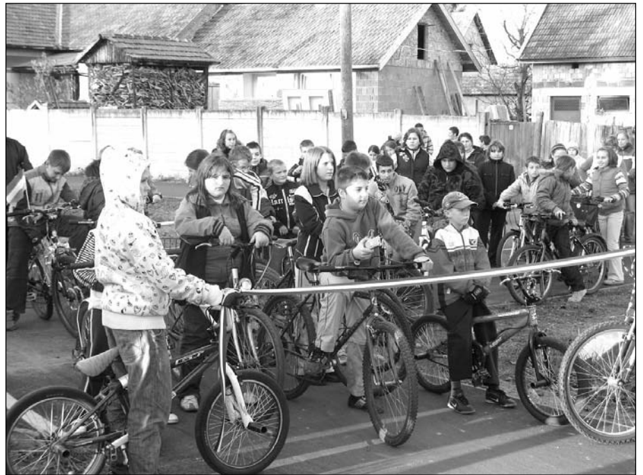
A kerékpárút birtokbavételére várva

A kerékpárúthoz kapcsolódó létesítményként jövőre megkezdődhet a szintén uniós forrásból megvalósuló zárt P+R parkoló és kerékpártároló építése a vasútállomáson, mely közel 40 gépkocsi és 40 db kerékpár biztonságos elhelyezésére nyújt lehetőséget. Úgy gondolom, hogy ezekkel a beruházásokkal a közlekedési lehetősé-