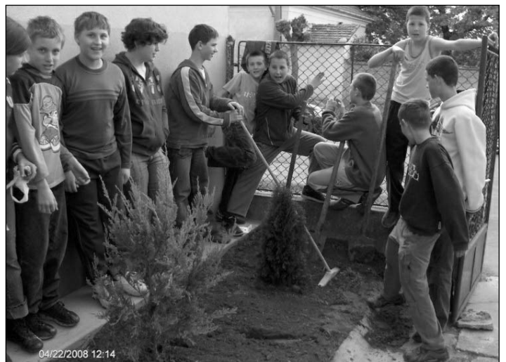
Föld napja a Székely József Református Iskolában