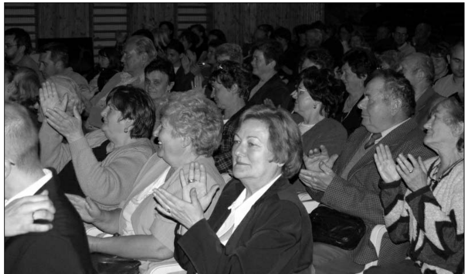
A vendégek egy csoportja

ves előadásának fő mondanivalója, hogy a Biblia élő könyv ma is. Mindenkié. Szent Könyv, de nem dísz, hanem napi használatra, olvasásra rendelt Írás.