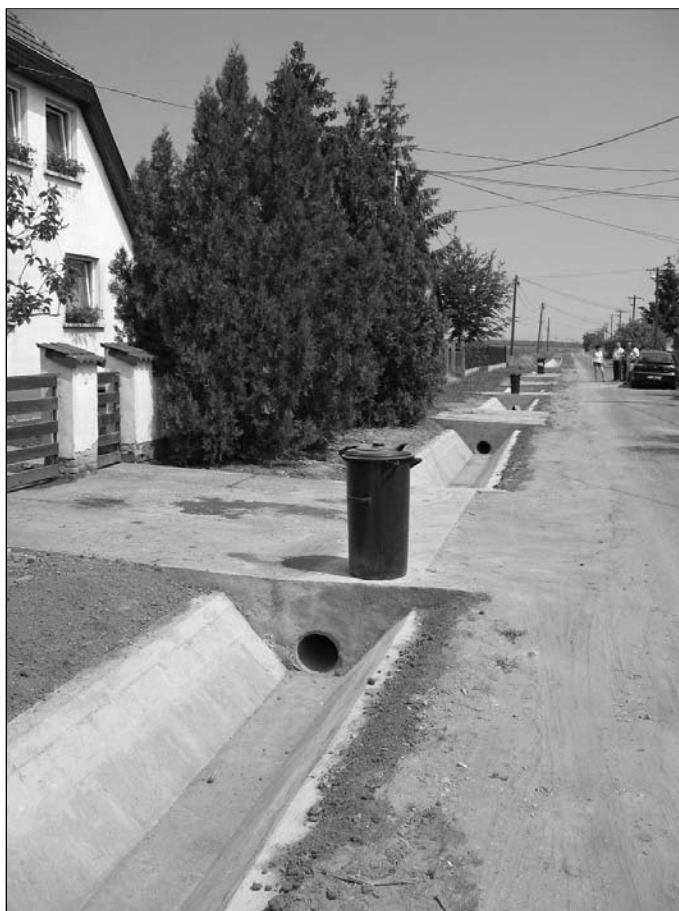
Felszíni vízvezetés (Határ út)

• Szeretném tájékoztatni Önöket az intézményfenntartói társulás megvalósíthatóságával kapcsolatos kérdésekről. Fenti téma „nagy port kavart” a településen. Beindult a rémhírterjesztés. Olyan valótlan dolgok kaptak szárnyra, hogy össze lesz vonva a két iskola, a pedagógusoknak, diákoknak át kell járni Szentlőrinc kátára, és hasonlók. Ezért most