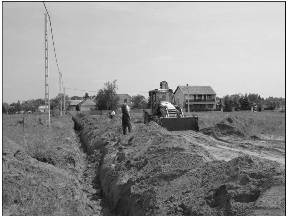
Gázvezeték fektetése településünk új utcájában (Jókai Mór utca)

• Nyertünk továbbá közel 6 millió forintot a benti orvosi rendelő akadálymentesítésére. Ez azért különösen jó, mert terveink szerint a régi gyógyszerár épületében alakítanánk ki a gyermekorvosi rendelőt, s így annak akadálymentesítése, a lépcsőn való feljutás kialakítása már részben megoldódna. A testület határozatban rögzítette azon szándékát, hogy a községben gyermekorvost szeretne alkalmazni. A gyermekorvosi állást folyamatosan hirdetjük, jelenleg két gyermekorvossal folytatott tárgyalásokat. A testület döntött továbbá a régi gyógyszerár épületének átminősítéséről, így gyermekorvosi rendelő ala-