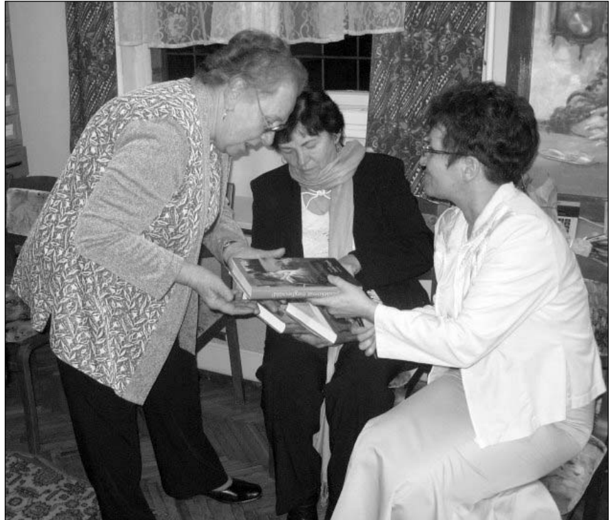
Az író nő dedikál

Turcsányi Béla művészként viselkedett. Hiszen a művész felelőssége – nemcsak önmagával, de a közönséggel szemben is – a kimondás. Hogy mindazt, amit megismert a valóságból, saját eszközeivel közvetítse.